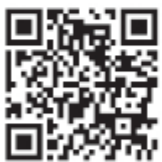
1. インプラント治療 サイナスウィンドウ開窓