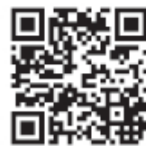
2. インプラント治療 2次開窓